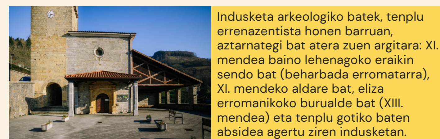
1 SAN JUAN BAUTISTA PARROKIA ELIZA IGLESIA PARROQUIAL DE SAN JUAN BAUTISTA 📍 Belauntza