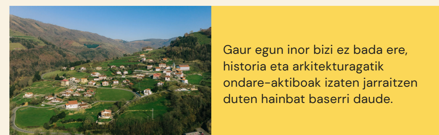
4 BASERRIAK CASERIOS 📍 Belauntza