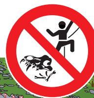
AZTARNATEGIA Eskalada debekatuta ¡YACIMIENTO! Prohibido escalar

Ayuda a impulsar las economías rurales utilizando los servicios de la zona y consumiendo productos locales. Si necesitas cualquier servicio, utiliza los que se ofrecen en el propio lugar, consume en tiendas, bares y puntos de venta de los baserriarros en los pueblos y pequeños barrios. Si estás instalado en algún aparcamiento o zona de camping libre, aprovecha para desayunar en alguna taberna de la zona. Además de promover los negocios locales, estarás ayudando a la naturaleza utilizando sus aseos.